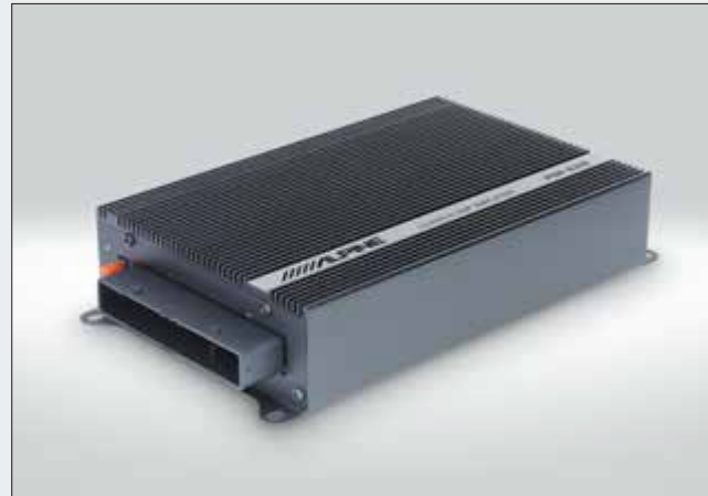
Amplificador digital de alta gama con diseño y ajustes de sonido específicos (PDP-E310ML).

* Para actualizar y mejorar el sistema de sonido original de ML W164. Puede utilizarse también con la radio original de fábrica.