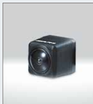
Cámara de múltiples vistas opcional (HCE-C252RD).

La pantalla dividida proporciona imágenes nítidas de las zonas posteriores izquierda y derecha.