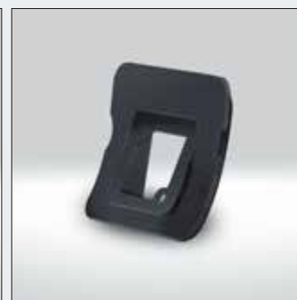
Kit de instalación de cámara (KIT-R1ML) compatible con el modelo ML del año 2008 y posteriores.