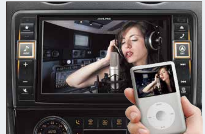
Entretenimiento móvil. Conecte sus dispositivos móviles analógicos o digitales para disfrutar de sus contenidos multimedia durante el trayecto.

El X800D-ML le permite disfrutar de películas, vídeos musicales y otros contenidos desde diferentes fuentes, como los DVD desde el mecanismo integrado que dispone, conexión USB, últimos modelos de smartphones con salida HDMI o dispositivos portátiles de vídeo conectados en la entrada AUX IN (pueden requerirse cables opcionales). También puede conectar su iPod o iPhone para disfrutar de su contenido de vídeo en la pantalla grande de 8 pulgadas. Por razones de seguridad en la conducción, la reproducción de vídeo solo está disponible si el vehículo no está en movimiento.