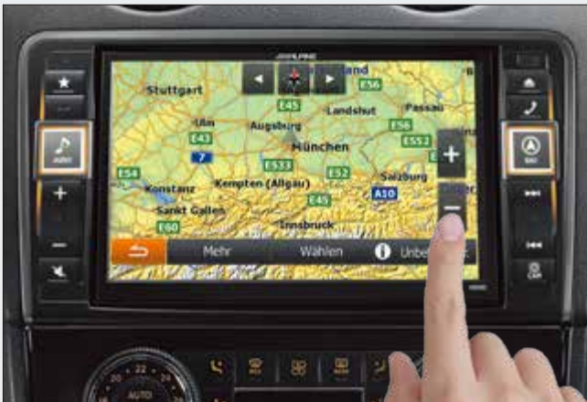
Pantalla táctil WVGA de alta resolución de 20 cm (X800D-ML).

La pantalla de alta resolución de 8 pulgadas (20,3 cm) es un 60% más grande que la pantalla original del ML y ofrece la tecnología de vídeo más reciente para obtener una claridad, un contraste y una resolución de imagen sobresalientes. Permite mostrar los mapas de navegación con un detalle asombroso, mientras que la reproducción de las películas o los vídeos se convierten en una verdadera experiencia cinematográfica. También contribuye a la seguridad durante la conducción: los detalles del mapa de navegación se ven más fácilmente y las teclas de introducción del destino son más grandes y fáciles de utilizar.