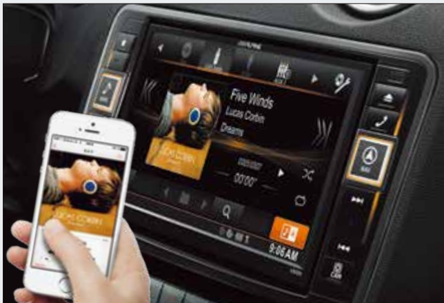
Made for iPod. Visualice toda la información de un vistazo.

Si conecta un iPod, dispositivo USB o smartphone, dispondrá de acceso a toda su biblioteca musical. Es fácil buscar por artista, álbum, tema, género o lista de reproducción. La búsqueda alfabética le resultará de gran ayuda para navegar rápidamente por la biblioteca y encontrar lo que busca. Los libros de audio y podcasts son también excelentes para mantenerle entretenido.