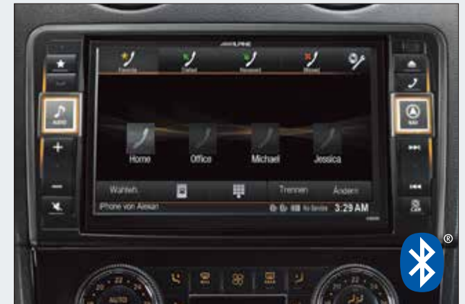
La última tecnología Bluetooth® disponible para funciones de manos libres y reproducción de audio.

El módulo Bluetooth® integrado permite la conexión inalámbrica con terminales móviles para establecer la comunicación en modo manos libres, y las frecuentes actualizaciones de software aseguran total compatibilidad con los últimos modelos de teléfonos. Una interfaz de usuario muy intuitiva facilita el manejo e incluye también una función de marcación rápida para los contactos más habituales. La tecnología Bluetooth® permite también reproducir el contenido musical de su teléfono. Los archivos de audio y la radio por internet se pueden transferir inalámbricamente al X800D-ML.