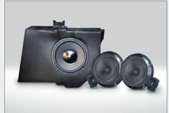
Sistema de altavoces y subwoofers de alta calidad (SPC-100ML).

* Para actualizar y mejorar el sistema de sonido original de ML W164. Requiere PDP-E310ML.