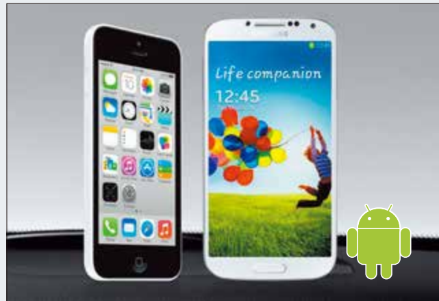
Permanezca conectado. El X800D-ML es compatible con los smartphones más recientes.

El sistema Alpine asegura la compatibilidad con los smartphones más recientes, tales como el iPhone 5S/C, el Samsung Galaxy S5 o el HTC One. Esto ofrece muchas ventajas: puede disfrutar de sus contenidos digitales almacenados en su teléfono, como sus vídeos o música preferida, acceso a su agenda, o simplemente cargar la batería del terminal. Puede incluso activar el SIRI y controlar su iPhone por voz para obtener una máxima comodidad y seguridad de conducción.