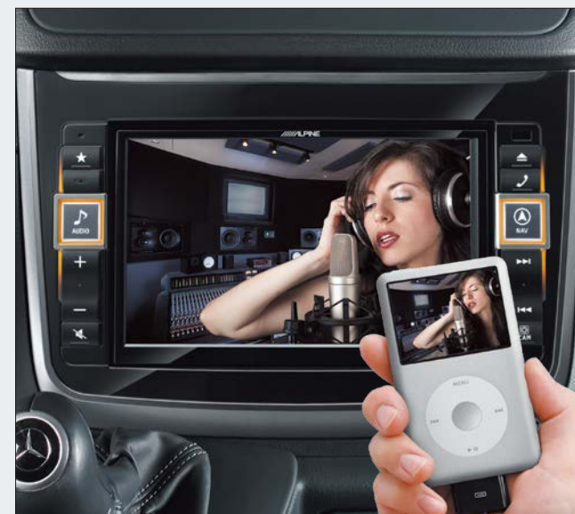
Entretenimiento móvil. Conecte sus dispositivos móviles analógicos o digitales para disfrutar de sus contenidos multimedia durante el trayecto.

El X800D-V le permite disfrutar de películas, vídeos musicales y otros contenidos desde diferentes fuentes, como los DVD desde el mecanismo integrado que dispone, conexión USB, últimos modelos de smartphones con salida HDMI o dispositivos portátiles de vídeo conectados en la entrada AUX IN (pueden requerirse cables opcionales). También permite conectar su iPod o iPhone y disfrutar de su contenido de vídeo en pantalla de gran tamaño. Por razones de seguridad en la conducción, la reproducción de vídeo solo está disponible si el vehículo no está en movimiento.