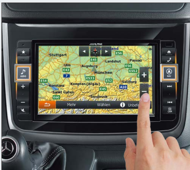
Pantalla táctil WVGA de alta resolución de 20 cm (X800D-V).

La pantalla de alta resolución de 8 pulgadas (20,3 cm) es un 60% más grande que la pantalla original de la Vito / Viano y ofrece la tecnología de vídeo más reciente para obtener una claridad, un contraste y una resolución de imagen sobresalientes. Permite mostrar los mapas de navegación con un detalle asombroso, mientras que la reproducción de las películas o los vídeos se convierten en una verdadera experiencia cinematográfica. También contribuye a la seguridad durante la conducción: los detalles del mapa de navegación se ven más fácilmente y las teclas de introducción del destino son más grandes y fáciles de utilizar.