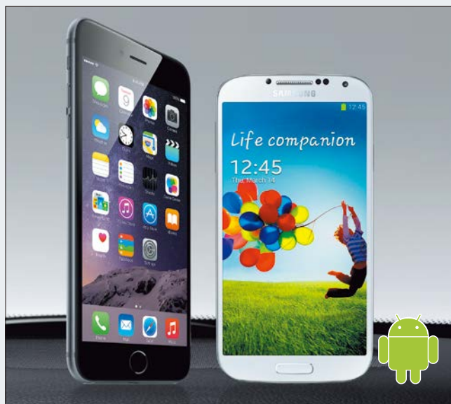
Permanezca conectado. El X800D-V es compatible con los smartphones más recientes.

El sistema Alpine asegura la compatibilidad con los smartphones más recientes, tales como el iPhone 6 y 6 Plus, el Samsung Galaxy S5 o el HTC One. Esto ofrece muchas ventajas: puede disfrutar de sus contenidos digitales almacenados en su teléfono, como sus vídeos o música preferida, acceso a su agenda, o simplemente cargar la batería del terminal. Puede incluso activar el SIRI y controlar su iPhone por voz para obtener una máxima comodidad y seguridad mientras conduce.